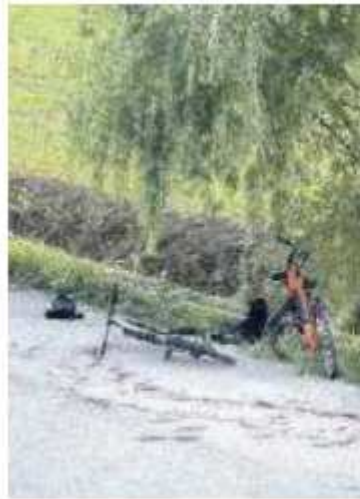
RESTI I pezzi della "bomba"

►Feriti due sedicenni che facevano parte del gruppetto S'indaga sull'ordigno, una sorta di bomba carta artigianale