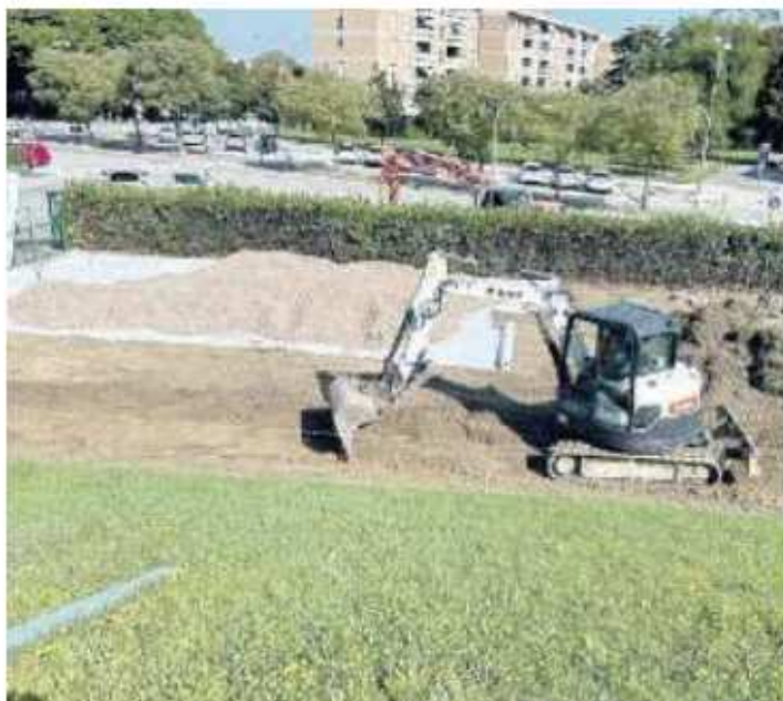
MIRANO Ruspe davanti al piazzale delle piscine comunali in via Matteotti, nella zona dei campi sportivi