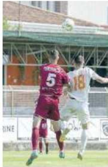
IL MATCH La Clodiense aspetta la neopromossa Treviso