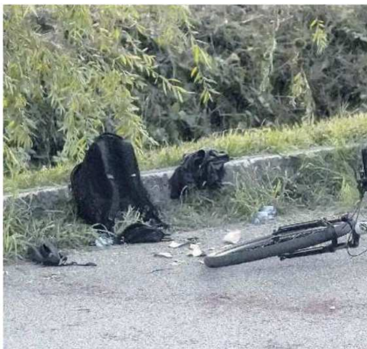
CARBONIZZATI I resti dell'esplosione ai bordi della strada nella campagna di Mirano

Per il momento le certezze in ballo sono solo due: quella bomba carta è esplosa e un 21enne della zona ci ha rimesso mano e parte del braccio. Per il momento si è sentita solo la versione dei due ragazzini rimasti illesi: gli altri tre, il più grande, ricoverato in gravi condizioni a Mestre, e i due sedicenni portati in ospedale a Mirano con lesioni lievi, verranno sentiti in un secondo momento. La situazione è stata poco chiara fin dal primo momento: la polizia locale, infatti, inizialmente era intervenuta convinta di dover rilevare un incidente stradale tra motorini. Quando sono arrivati sul posto, però, hanno capito che le cose erano andate ben diversamente. I ragazzi hanno raccontato agli agenti e ai carabinieri di Mirano, arrivati in supporto dei "cugini" vista la gravità del caso, di aver trovato quell'ordi-